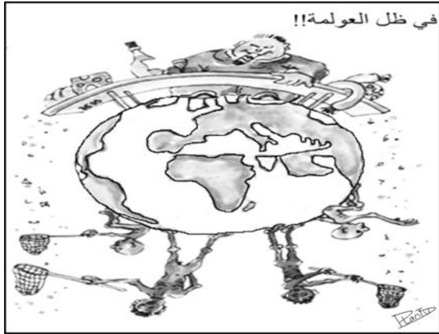
المستند رقم (٣)

... إنّ العالم الصناعي مسؤول رئيسي عمّا تعاني منه شعوب دول عالم الجنوب النامي، لأنّ مشاكل هذا العالم، كما هي محلية، فهي مصدرّة إليهم. فالناس يعيشون في الفقر والعوز والحاجة، لأن أغنياء الدول الصناعية يعيشون مرفهين على حسابهم.