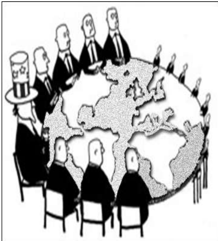
المستند رقم (2- ب)